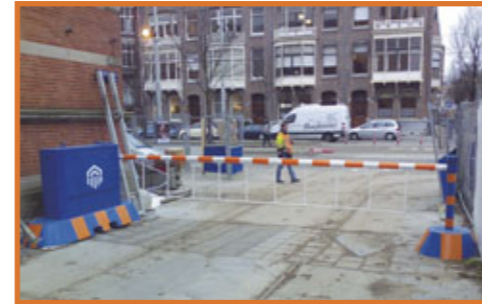
'In the middle of nowhere & in the middle of everything'. De ene dag midden in een weiland, de volgende in het centrum van de stad.