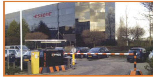
Car Gate, juist voor die plekken waar grote investeringen beschermd moeten worden.